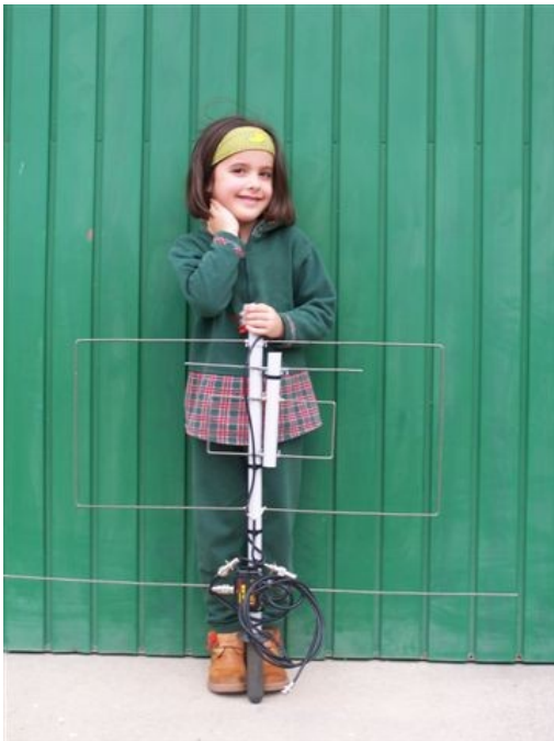
firmes y la antena plegada

no son críticas, aunque bien de una longitud a otra puede cambiar algo la ROE pero nunca fuera de los márgenes que he comentado anteriormente, esto es como consecuencia de que la antena en el punto de resonancia no tiene los 50 Ohmios deseables. Por último aconsejaros que utilizéis conectores “BNC” o “N” con preferencia a los “PL” para estas frecuencias, así como el mejor cable que podáis encontrar, en mi caso es RG223 que siendo un cable de la misma sección que el RG58 tiene menos pérdidas. Si queréis que la antena quede mas coqueta, la marca ARROW vende un microduplexor que soporta solo 10 Watios, pero que cabe dentro del boom, su precio son unos 60 $. Si vais a utilizar la antena en lugares frecuentados también es aconsejable instalar unos tapones en el extremos de los reflectores, para no dañar a nadie que esté en las inmediaciones.