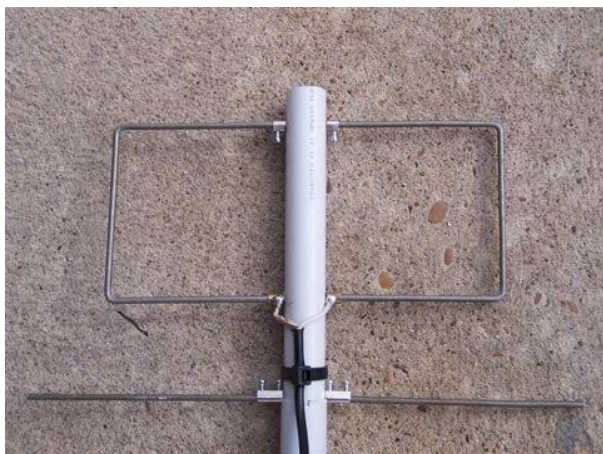
Foto 4: Detalle de fijación de los elementos al boom y conexión del coaxial al elemento radiante

Como a la realidad no llega nada, le pedí a Tomás EA4BUG que me prestara su analizador de antenas, un MFJ259-B. El analizador mostró a lo largo de las bandas de VHF y UHF una impedancia entre 40 y 75 Ohmios, esto se traduce en una relación de SWR entre 1:1.3 y 1:1.9. A la vista de estos resultados llegué a la conclusión de que no merecía la pena complicar la antena haciendo latiguillos de enfase para adaptar la impedancia. Además la antena sería mucho mas sencilla eléctricamente, lo cual es un punto importante si queremos tener éxito su construcción.