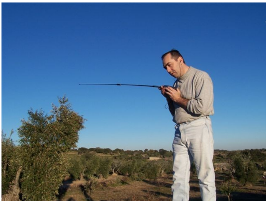
Foto 1: EA4CYQ trabajando con WT y antena omnidireccional de alta ganancia

Seguramente que con estas premisas se pueden construir varios modelos. Pero la pregunta era ¿Qué tipo de antena tiene la ganancia que una yagui en menos longitud de boom?. Bien la respuesta es las antenas cúbicas. Todos hemos leído que cuando una yagui no tiene muchos elementos, en la misma longitud de boom las cúbicas tienen mas ganancia. Pero una antena cúbica es tridimensional, por lo tanto ya no cumplimos una de las premisas a no ser que se pudieran plegar los cuadros. Este camino me pareció mecánicamente complicado.