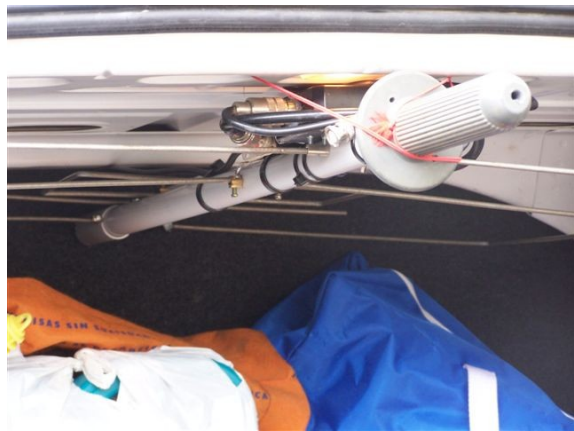
Foto 9: Antena guardada, fijada en el techo del maletero del coche

Podéis ver la antena en manos de mis sobrinas que amablemente posaron con ella en mano (Foto 6 y Foto 7), la verdad es que en las fotos aflora mas el amor de tío (por lo guapas que son), que el de padre (por haber parido la antena). El boom tiene un manguito de empalme entre las antenas de ambas bandas, que permite acortar su longitud para guardarla en el maletero (Foto 8). Y como la idea era guardarla sin que ocupara mucho espacio, podéis también observar como ha quedado acoplada al techo del maletero del coche (Foto 9).