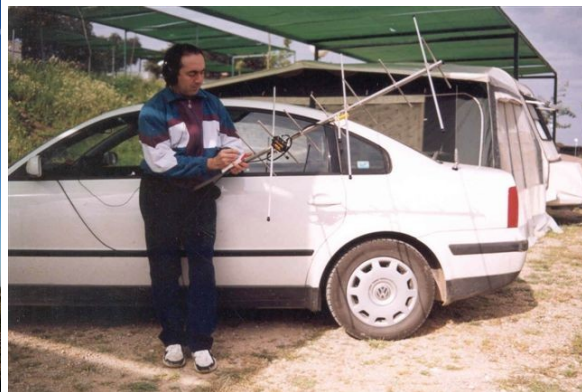
Foto 2: EA4CYQ trabajando con emisora de coche y antena ARROW de fabricación casera